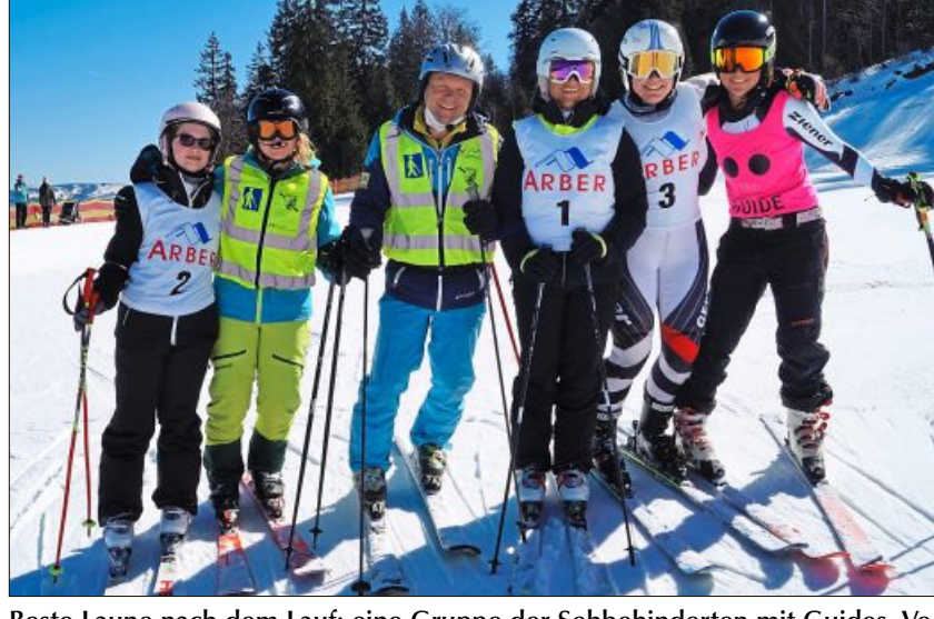
Beste Laune nach dem Lauf: eine Gruppe der Sehbehinderten mit Guides. Verena Bentele hatte die Startnummer 1.